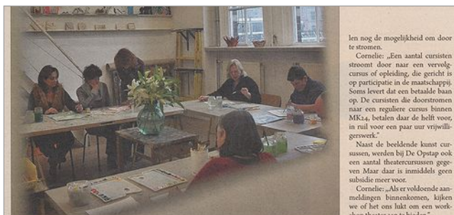
Cursisten van De Opstap ontdekken hun creativiteit tijdens de schilderlessen.

In MUG Magazine van maart 2011 staat een artikel over De Opstap