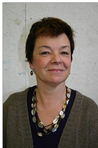
Kaj Glasbergen, www.kajglasbergen.nl